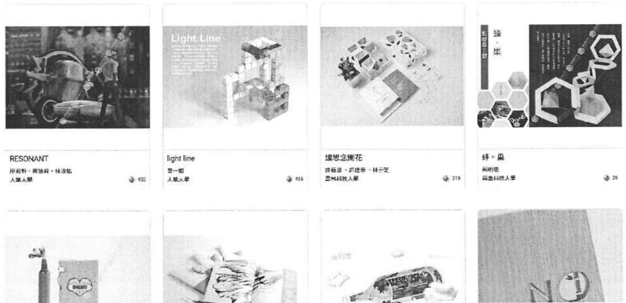
設計師之手數位設計展示平台 展示主頁面