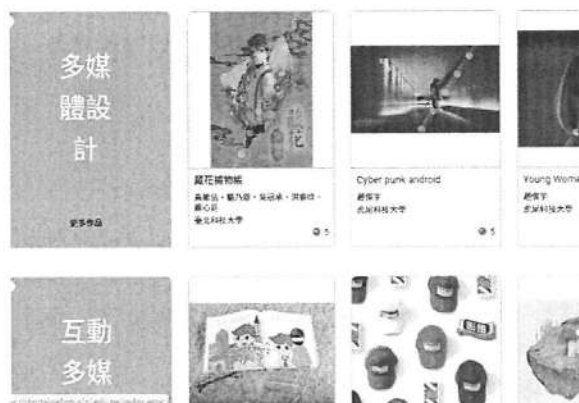
可依各作品類型線上瀏覽