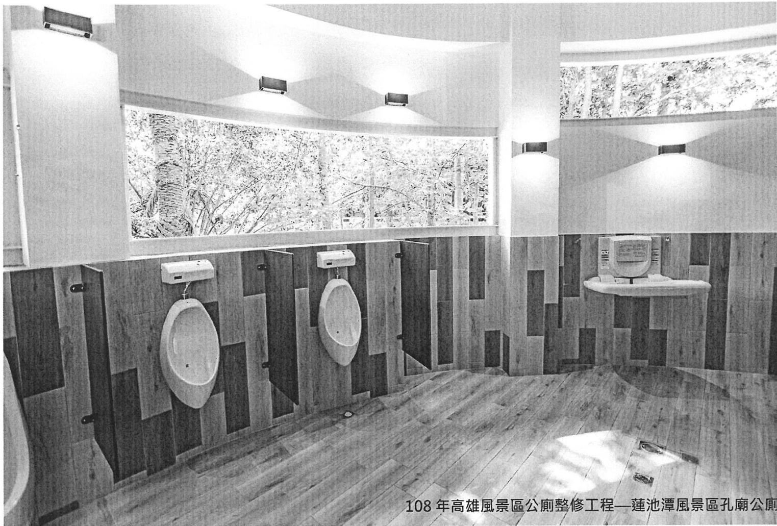
108 年高雄風景區公廁整修工程—蓮池潭風景區孔廟公廁